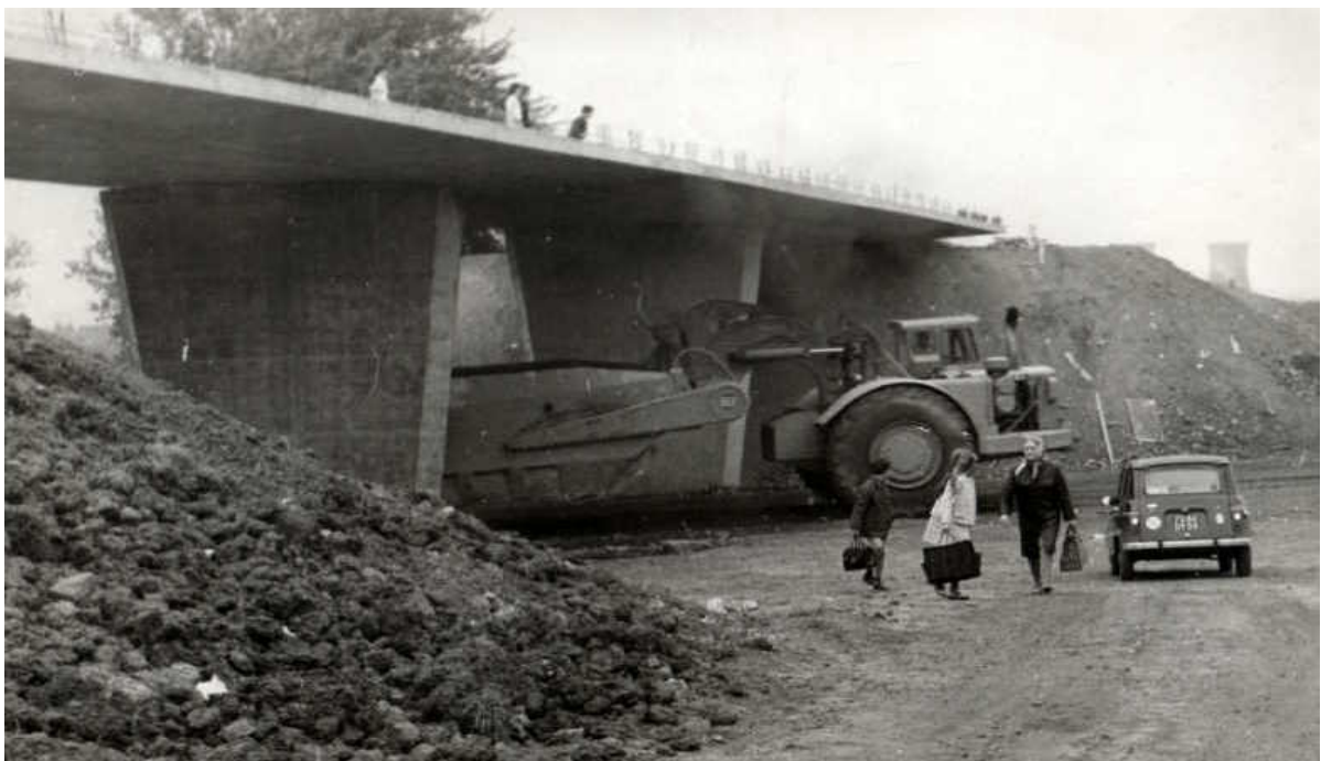
Construction du pont qui surplombe l'autoroute rue Pasteur