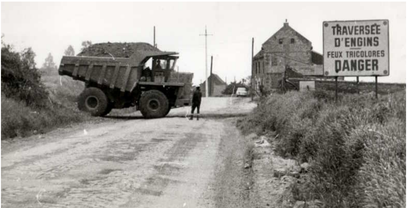
Travaux près du lieu-dit la Tannerie, rue d'Avesnes le Sec. Cette rue était pavée à l'époque